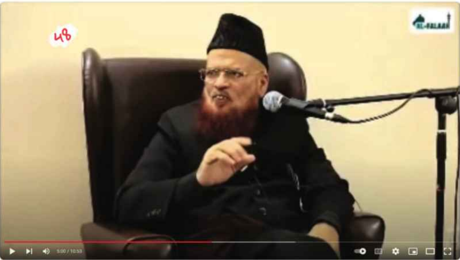
Mufti Taqi Usmani Views About Toheen e Risalat Law and Against Mumtaz Qadri